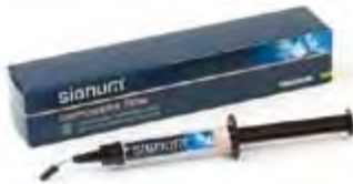
Signum Composite Flow Kulzer