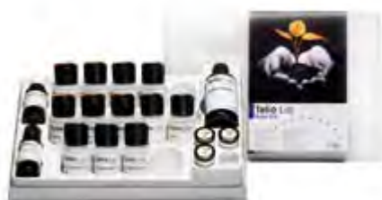
Telio Lab Ivoclar Vivadent

Resina bicomponente (polvere/liquido) per la realizzazione di provvisori a lungo termine per la polimerizzazione a freddo. Indicata per corone e ponti, sia su monconi naturali, sia su abutment per impianti. Inoltre, possono essere realizzati provvisori con denti sgusciati e possono essere eseguite ribasature di protesi provvisorie. Si può applicare a scelta mediante tecnica di colaggio o iniezione.