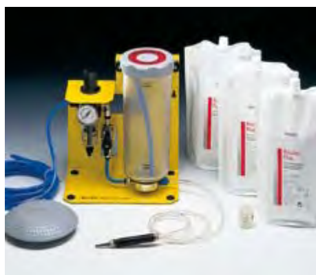
Rocatec Junior 3M Espe