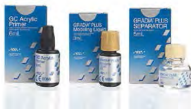
Gradia Plus GC

Punte erogazione ad ago con coperchio fotoprotettivo