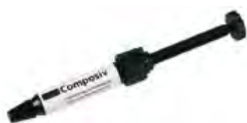
Accessori per resine composite Ivoclar Vivadent