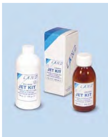
Jet Kit Lang

Resina acrilica autopolimerizzante , priva di pigmenti di cadmio, con elevata resistenza all'abrasione ed ai carichi masticatori. Ideale per la realizzazione di ponti e corone provvisori a lunga durata con tecnica indiretta.