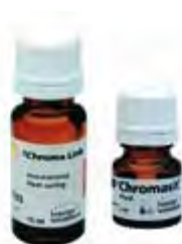
SR Chromasit Ivoclar Vivadent