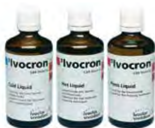
SR Ivocron Ivoclar Vivadent