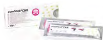
EverStick C&B GC

Fibre di vetro pronte all'uso, facili e veloci da applicare. Resistenti come il metallo, elevata adesione chimica (IPN). EverStick C&B per la protesi estetica, ponti e retainer superficiali, alette per Maryland, ponti definitivi, ponti tradizionali, ponti provvisori.