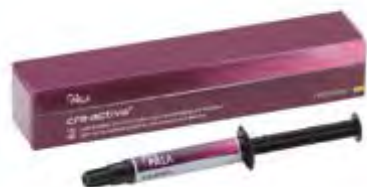
Signum Cre-Active Kulzer

Materiale composito fotopolimerizzabile per la caratterizzazione degli scudi gengivali in protesi mobile.