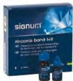
Accessori resine composite Kulzer