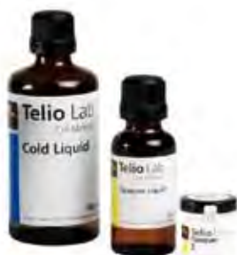
Telio Lab Ivoclar Vivadent