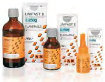
Unifast III GC

Resina acrilica autopolimerizzante , multifunzionale, per realizzare inlay, corone e ponti provvisori di lunga durata e per riparazione di protesi mobili fratturate. Sviluppata con tecnologia SURF (tecnologia di fissaggio rivoluzionaria per una superficie uniforme) permette di ottenere un'eccellente adattabilità, resistenza all'usura, durezza e forza di flessione. Adatta per tecniche a pennello e colata.