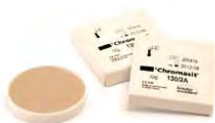
SR Chromasit Ivoclar Vivadent