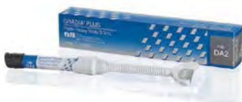
Gradia Plus GC