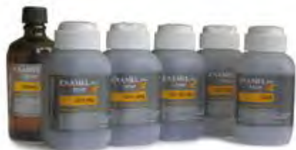
Enamel Plus TEMP

Resina autopolimerizzante per ponti e corone provvisori, estetici. Opacità delle masse dentina e traslucenza della masse smalto ottimali per evidenziare il contrasto tipico nel dente naturale. Le masse smalto consentono il raggiungimento di una lucidatura naturale nelle corone provvisorie, molto simile agli elementi definitivi in ceramica.