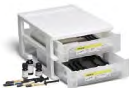
SR Nexco Paste Ivoclar Vivadent