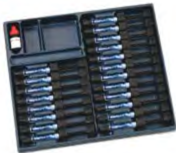
Signum Ceramis Kulzer