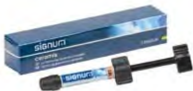
Signum Ceramis Kulzer