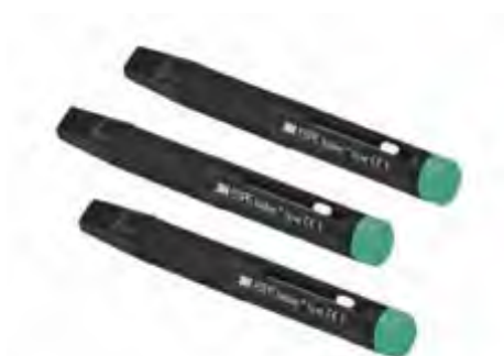
Sinfony M Espe