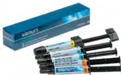
Signum Matrix Kulzer