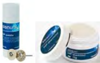
Accessori resine composite Kulzer