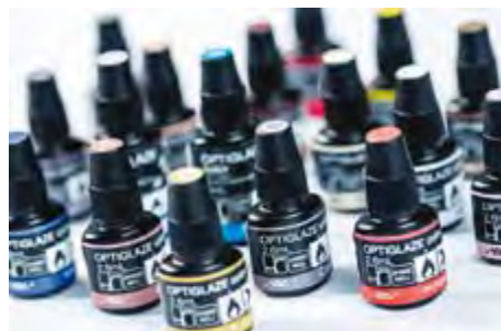
Optiglaze Color GC