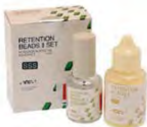
Retention Beads II SSS GC