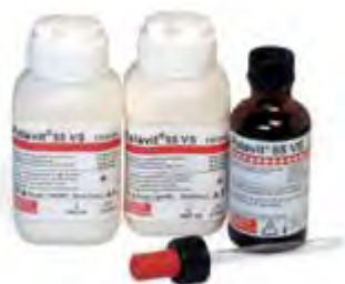
Palavit 55 VS Kulzer