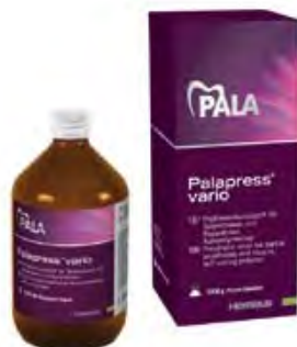
Palapress Vario Kulzer