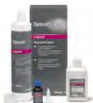
Optosil Fluid Kulzer