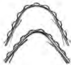
Barre Linguali Ritentive