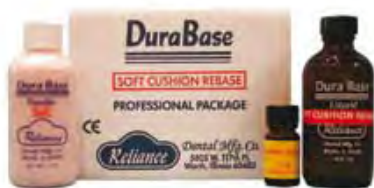
DuraBase Soft Reliance