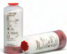
SR Ivocap Elastomero Ivoclar Vivadent