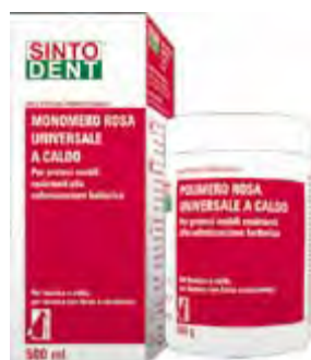
Sintodent Rosa Universale