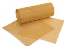
Reti di Rinforzo Renfert