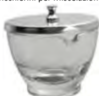
Mortai per Resina