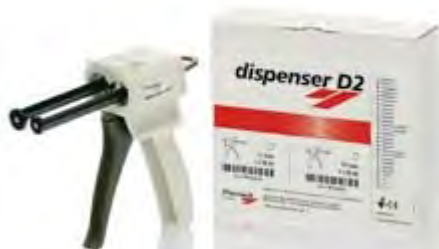
Dispenser D2 Zhermack