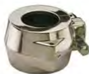
Muffola 105 Manfredi