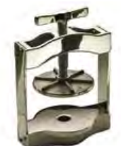
Staffa 361/362 Manfredi