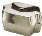
Muffola 330 Manfredi