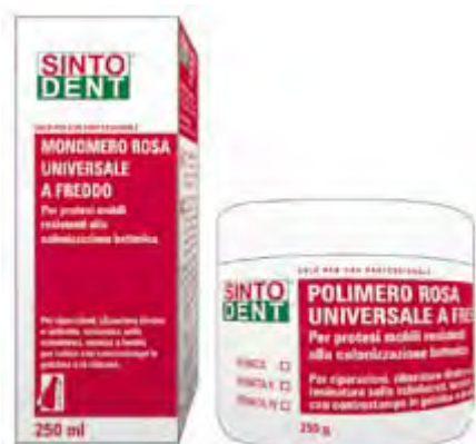
Sintodent Rosa Universale