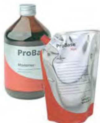
ProBase Hot Ivoclar Vivadent