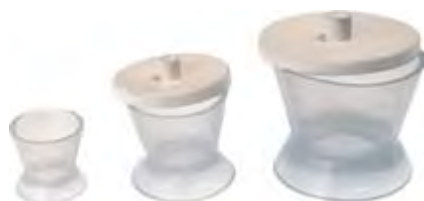
Tazze per Resina