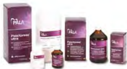
PalaXpress Ultra Kulzer

Nuova classe di resine a freddo Kulzer che è il 50 % più resistente alla frattura rispetto alle altre resine a freddo. Il segreto dell'elevata resistenza alla frattura di PalaXpress Ultra è un nuovo materiale con additivi a base di gomma. Queste particelle, molto solubili, danno vita ad una forte adesione con gli altri componenti del sistema polvere / liquido durante la polimerizzazione. In questo modo viene migliorata la stabilità di questa resina high-performance. Si evitano le micro fessure e quindi anche i possibili punti di frattura. Utilizzabile per tutte le richieste della protesica.