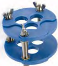
Apparecchio per Ribasare Apex Dental