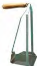
Pescatore di Jack