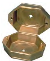
Muffola 110 Silfradent