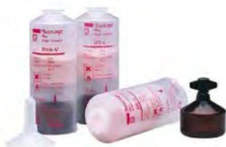
R Ivocap Plus High Impact Ivoclar Vivadent