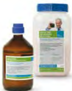
Acrylic Tras for Dentures Micro Pearl

Resina per protesi con cottura a freddo, di altissima qualità dotata di micro perle che garantiscono un colore molto stabile, una naturale ombreggiatura ed una perfetta e rapida polimerizzazione. La particolare composizione della polvere permette di ottenere un composto omogeneo e privo di agglomerati. Non contiene CADMIO né ammoni terziari. La nuova molecola con micro perle rende la resina compatta, lucida, resistente e copre in maniera eccellente, con poco spessore, le selle metalliche dello scheletrato. I vantaggi di Acrylic Tras Micro pearl: Riduzione delle contrazione e attenuazione del rilascio dei monomeri. Consente un miglior adattamento dei denti. Riduzione dello spessore della protesi all'estremità della superficie della bocca. Migliore miscelazione, lavorazione e lucidatura.