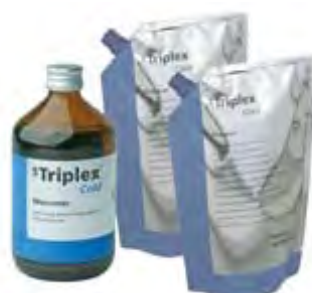
SR Triplex Cold Ivoclar Vivadent