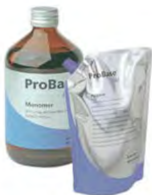
ProBase Cold Ivoclar Vivadent