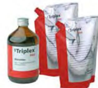
SR Triplex Hot Ivoclar Vivadent