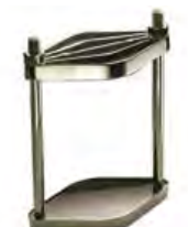
Staffe 370/1 - 370/2 Manfredi