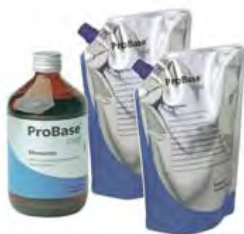
ProBase Cold Implant Shades Ivoclar Vivadent