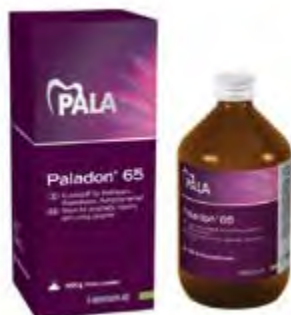
Paladon 65 Kulzer