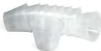
Bicchierini per Miscelazione