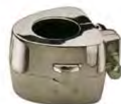
Muffola 360 Manfredi