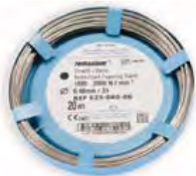
Filo in Acciaio Remanium Dentaurum