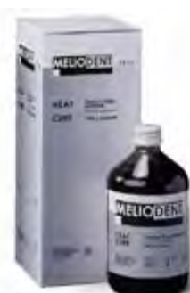
Meliodent Heat Cure Kulzer