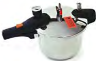
Pentola a Pressione SPD