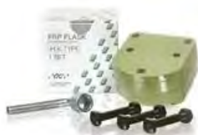
Acron MC Muffola GC