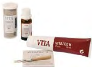
Vitafol H Vita