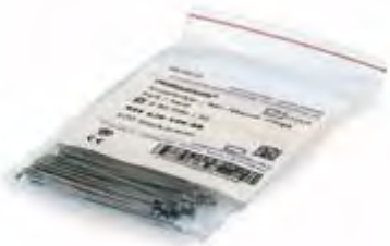
Ganci a Pallina Dentaureum