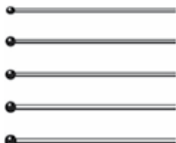
Ganci a Palla TP