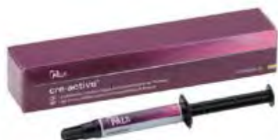
Pala Cre-Active Kulzer