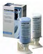
Flexistone Plus Detax