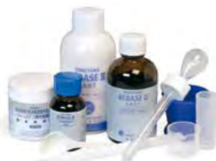
Rebase II Fast Tokuyama