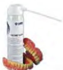
Protho Clean Hager Werken