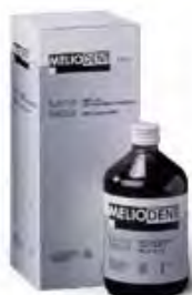
Meliodent Rapid Repair Kulzer