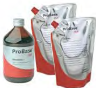
ProBase Hot Implant Shades Ivoclar Vivadent