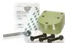
Acron MC GC